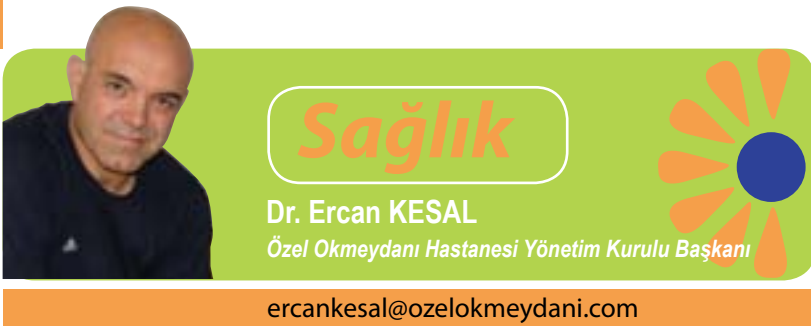
Dr. Ercan KESAL

Özel Okmeydanı Hastanesi Yönetim Kurulu Başkanı