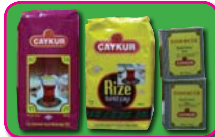
Çaykur, kiloluk ve Tomurcuk