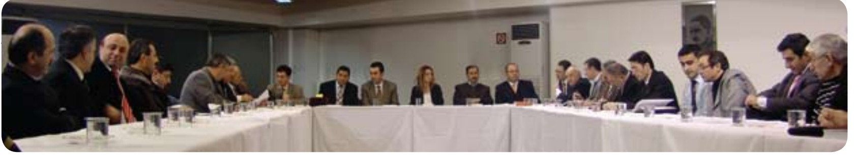
Perpa Muhasebe Meslek Grubu Toplantı Halinde

Perpa Gündem(PG): Perpa Muhasebe Meslek Grubu ne amaçla kurulmuştur?