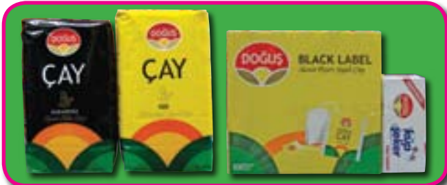
Doğuş Çay, Kiloluk, Demlik, Bardak poşet ve şeker