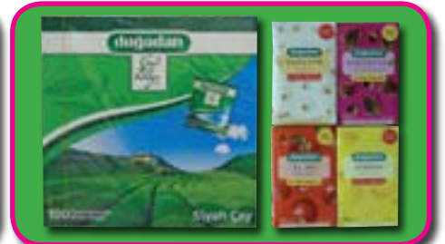
Doğadan, Yeşil Çay ve Meyve çayları