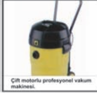
Çift motorlu profesyonel vakum makinesi