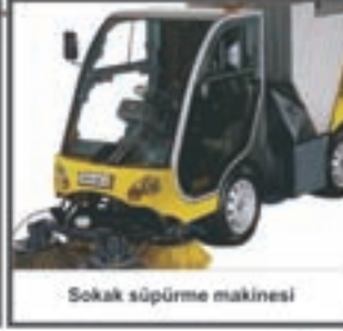
Sokak süpürme makinesi