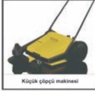
Küçük çöpçü makinesi

KÄRCHER tüm temizlik işlerinde profesyonel çözümler sunmaktadır.