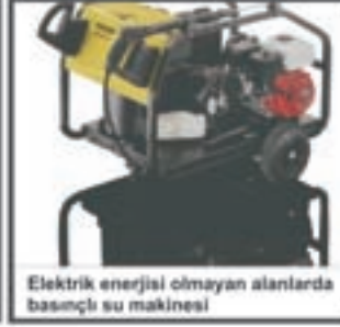
Elektrik enerjisi olmayan alanlarda basınçlı su makinesi