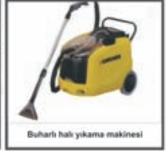
Buharlı halı yıkama makinesi